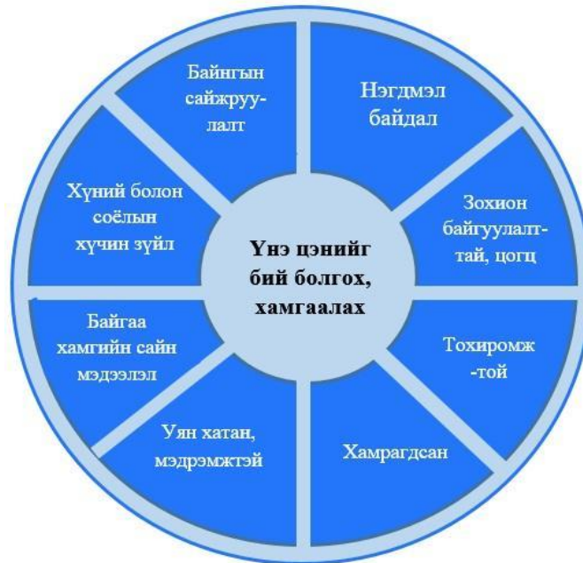
2-р зураг - Зарчим

2-р зурагт үзүүлсэн зарчмууд нь эрсдэлийн үр дүнтэй болон үр ашигтай менежментийн шинж чанар, түүний үнэ цэний тухай ойлголт, зорилт, зорилгоо тайлбарлах зааврыг тоймлон үзүүлсэн болно.